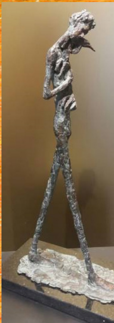
Giacometti with his dog