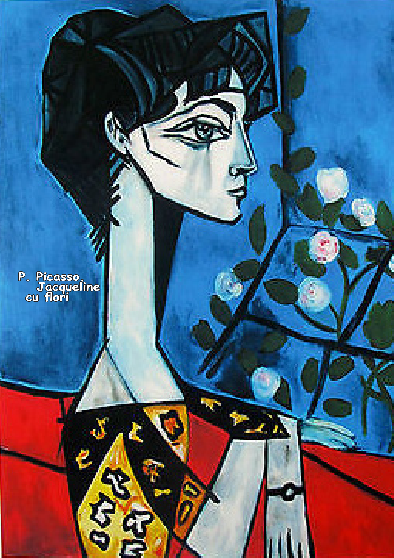
P. Picasso Jacqueline cu flori